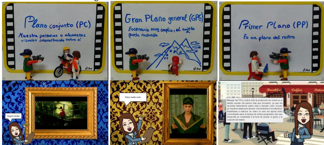
Fig 2. Ejemplos de reformulación teórica sobre los planos de un audiovisual elaborada por dos alumnos.